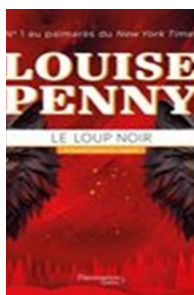
Le loup noir Louise Penny