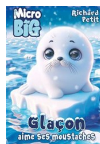
Glaçon aime ses moustaches Richard Petit