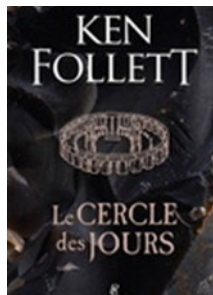
Le cercle des jours Ken Follett