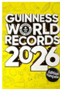
Records Guinness 2026 Édition française